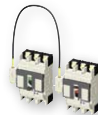
Žična mehanska blokada

Vrtljiva ročica se lahko v položaju OFF blokira s ključavnico