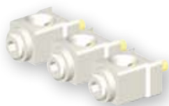
Priključna sponka SP2