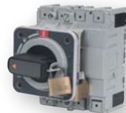
Direktna vrtljiva ročica