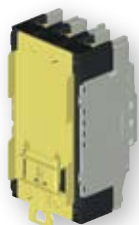
Adapter za montažo na DIN letev