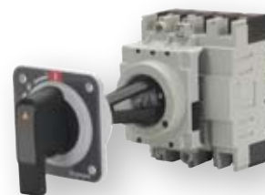
Podaljšana vrtljiva ročica odklopnika (montaža na vrata panela - blokada vrat)