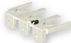
Prekritje sponk, izvlečljivi priklj.