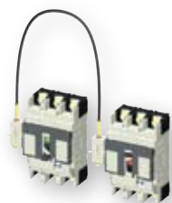
Žična mehanska blokada