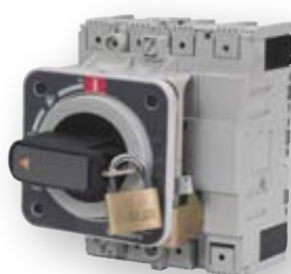
Direktna vrtljiva ročica