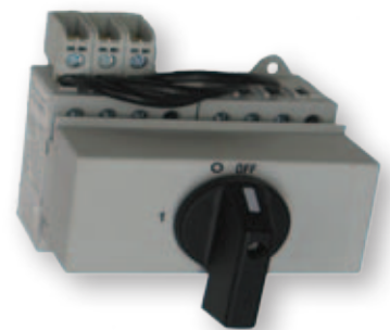
LAS 16-40 3p COP